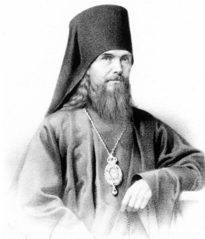
Свт. Феофан Затворник [23 янв., 29 июня н.ст.]

(Лк. 5, 1-11). Целую ночь трудились рыбаки и ничего не поймали; но когда Господь вошел в их лодку и, после проповеди, велел забросить мрежу, поймалось столько, что вытаскать не могли и мрежа прорвалась. Это образ всякого труда без помощи Божией, и труда с помощью Божией. Пока один человек трудится, и одними своими силами хочет чего достигнуть - все из рук валится; когда приблизится к нему Господь, - откуда потечет добро за добром. В духовно-нравственном отношении невозможность успеха без Господа осязательно видна: "без Мене не можете творить ничесоже", сказал Господь. И этот закон действует во всяком. Как ветка, если не сращена с деревом, не только плода не приносит, но иссыхая и живность теряет, так и люди, если не состоят в живом общении с Господом, плодов правды, ценных для жизни вечной, приносить не могут. Добро какое и бывает в них иногда, только на вид добро, а в существе недоброкачественно; как лесное яблоко и красно бывает с виду, а попробуй - кисло. И во внешнем, житейском отношении тоже осязательно видно: бьется, бьется иной, и все не в прок. Когда же низойдет благословение Божие, - откуда что берется. Внимательные к себе и к путям жизни опытно знают эти истины.