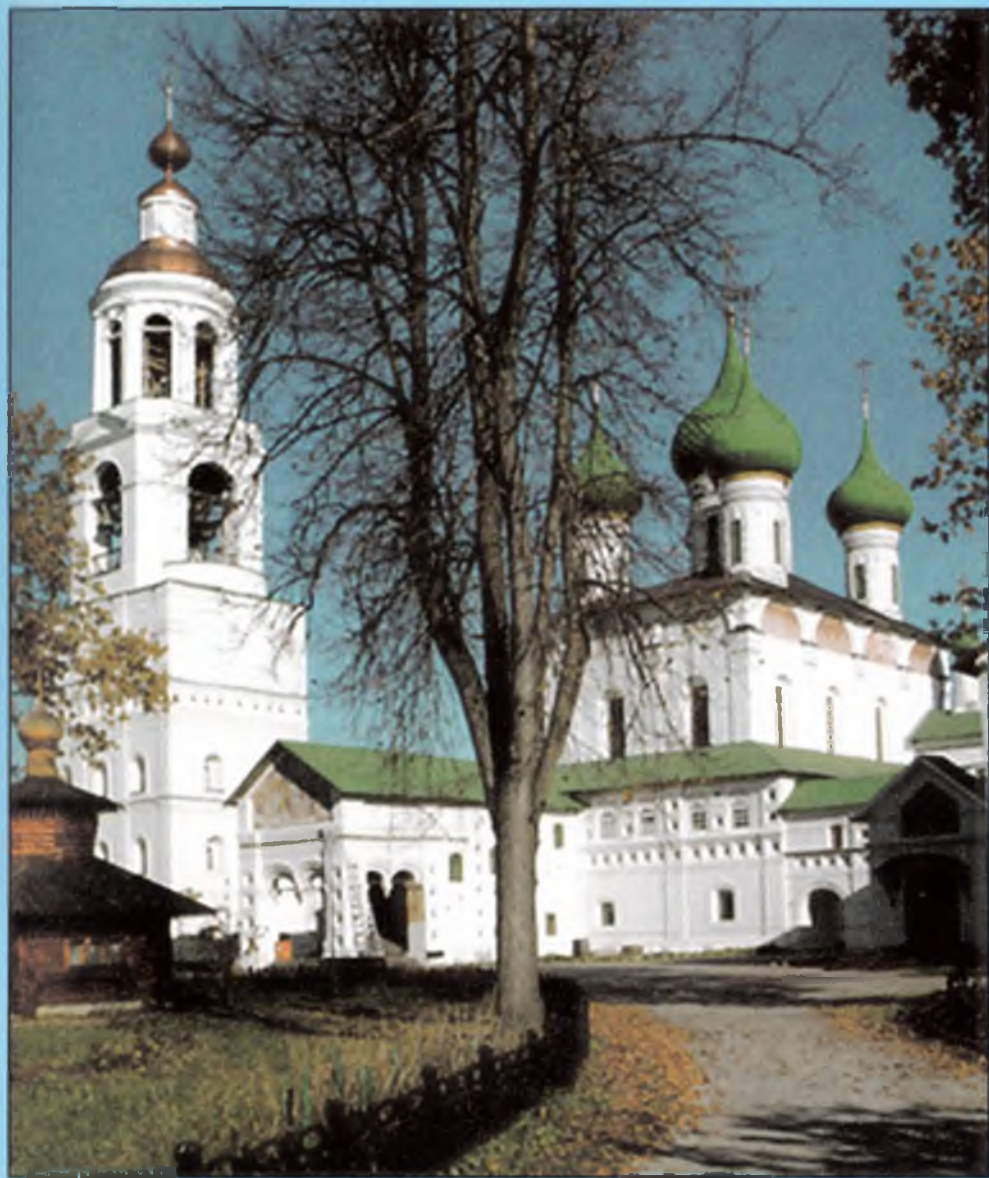
Толгский Свято-Введенский женский монастырь