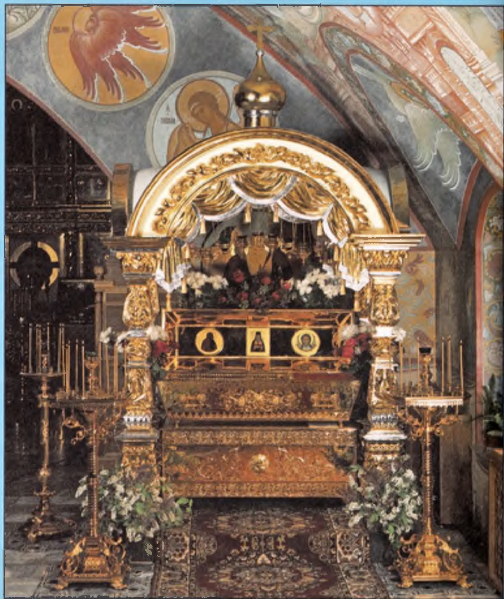
Рака с мощами святителя Игнатия Брянчанникова в Крестовоздвиженском храме Толгского монастыря